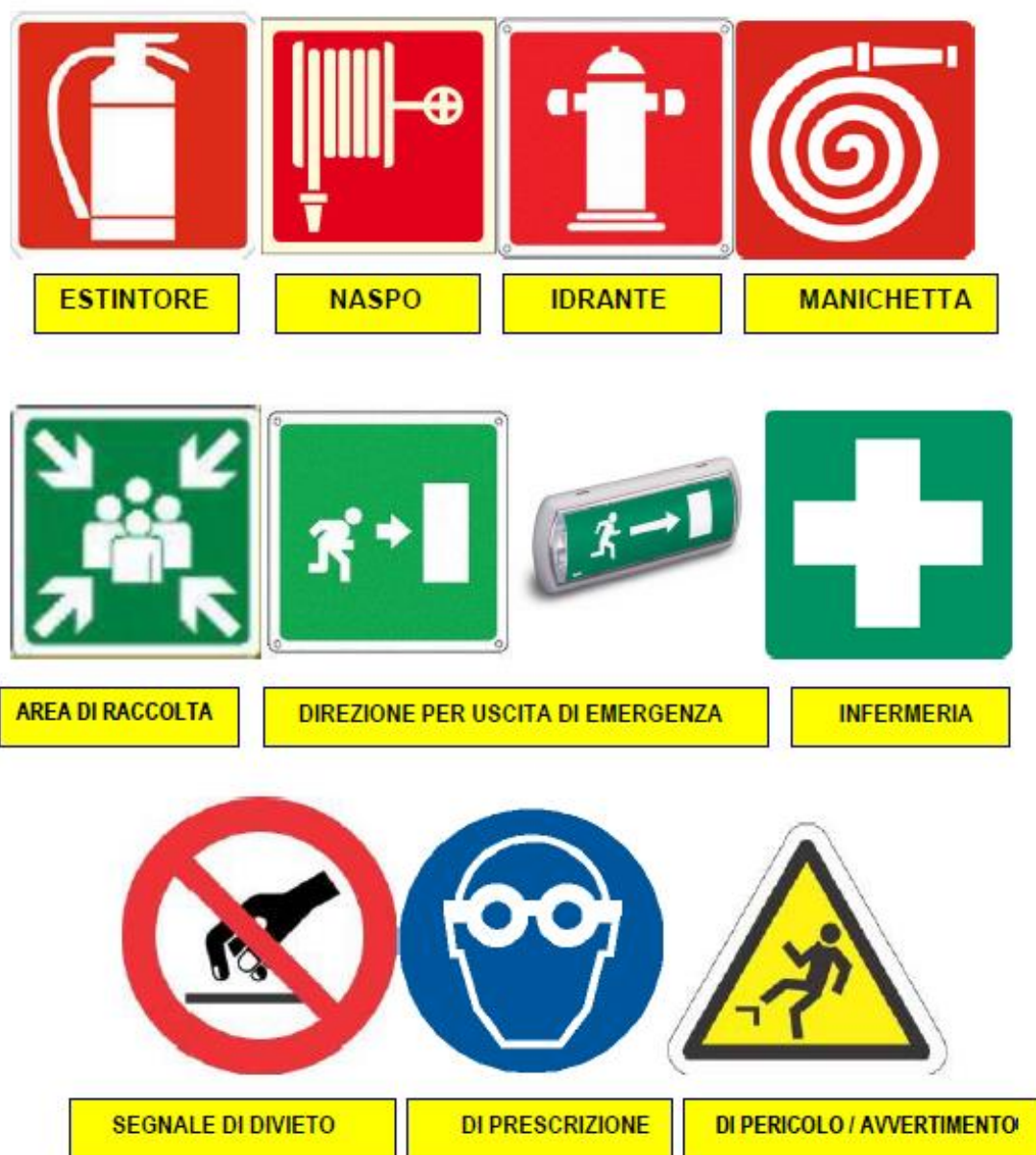
Figura 2: segnaletica di sicurezza

Ai fini di una corretta informazione sul piano di emergenza si riporta la principale segnaletica di lotta antincendio ed evacuazione, presente in Istituto, e le tipologie generali di cartelli di segnalazione antinfortunistica (segnali di divieto, obbligo o prescrizione, pericolo o avvertimento).